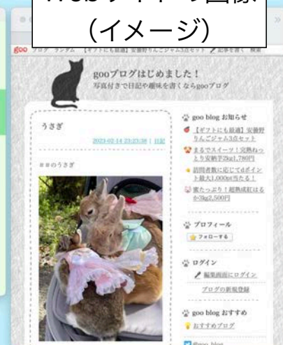
Webサイトの画像 (イメージ)