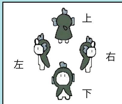
ムツゴロウの動き